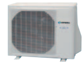
AGH9 / 12Ui