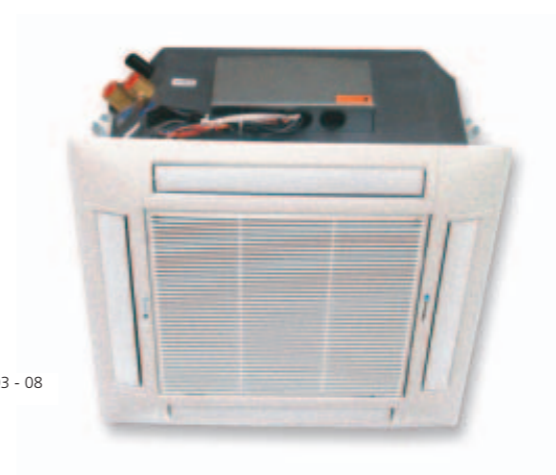
FCH 03 - 08