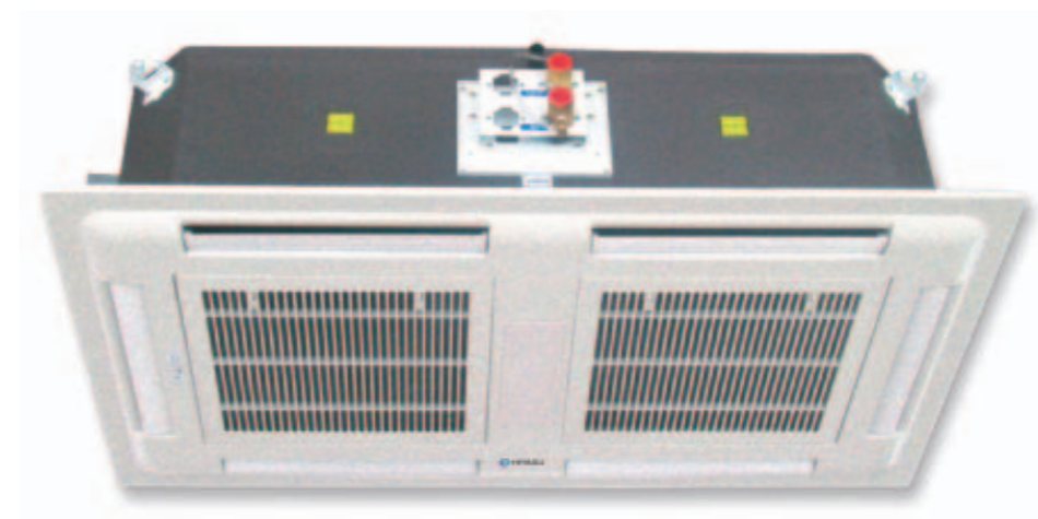
FCH 09 - 16